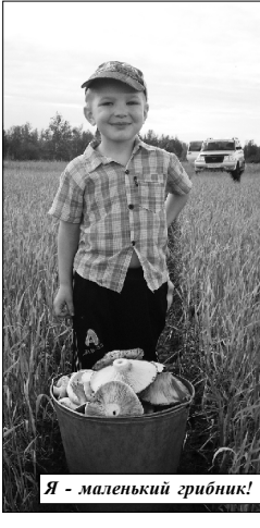
Я - маленький грибник!