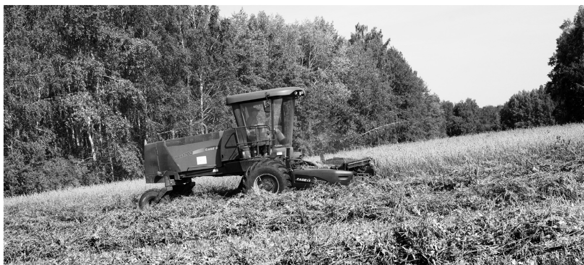
Горохо-овсяная смесь скашивается на сенаж