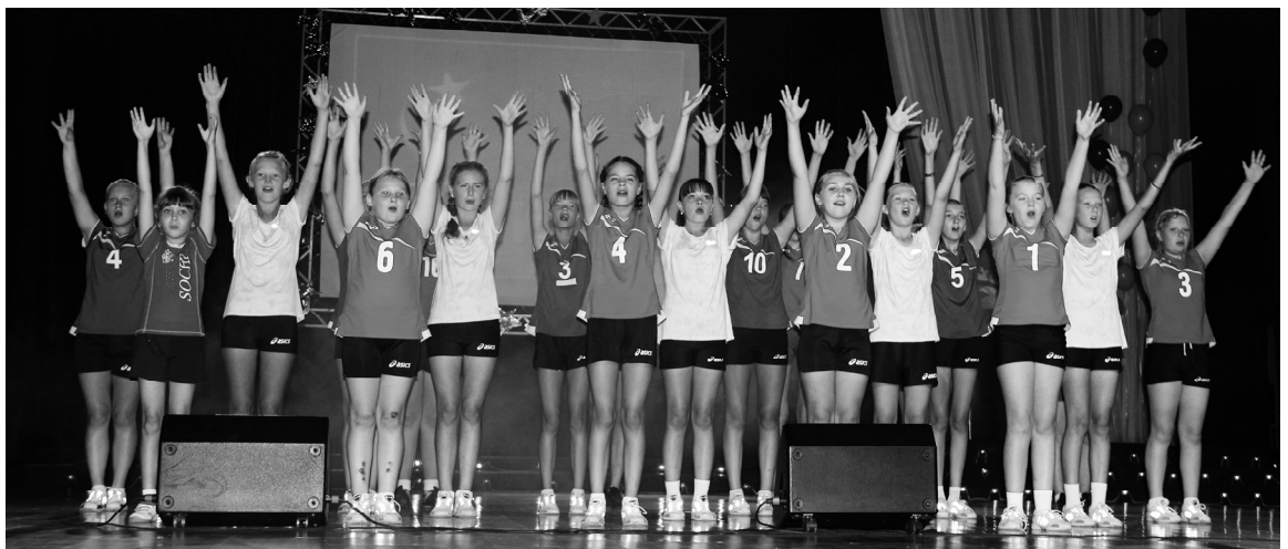
Во время церемонии на сцене