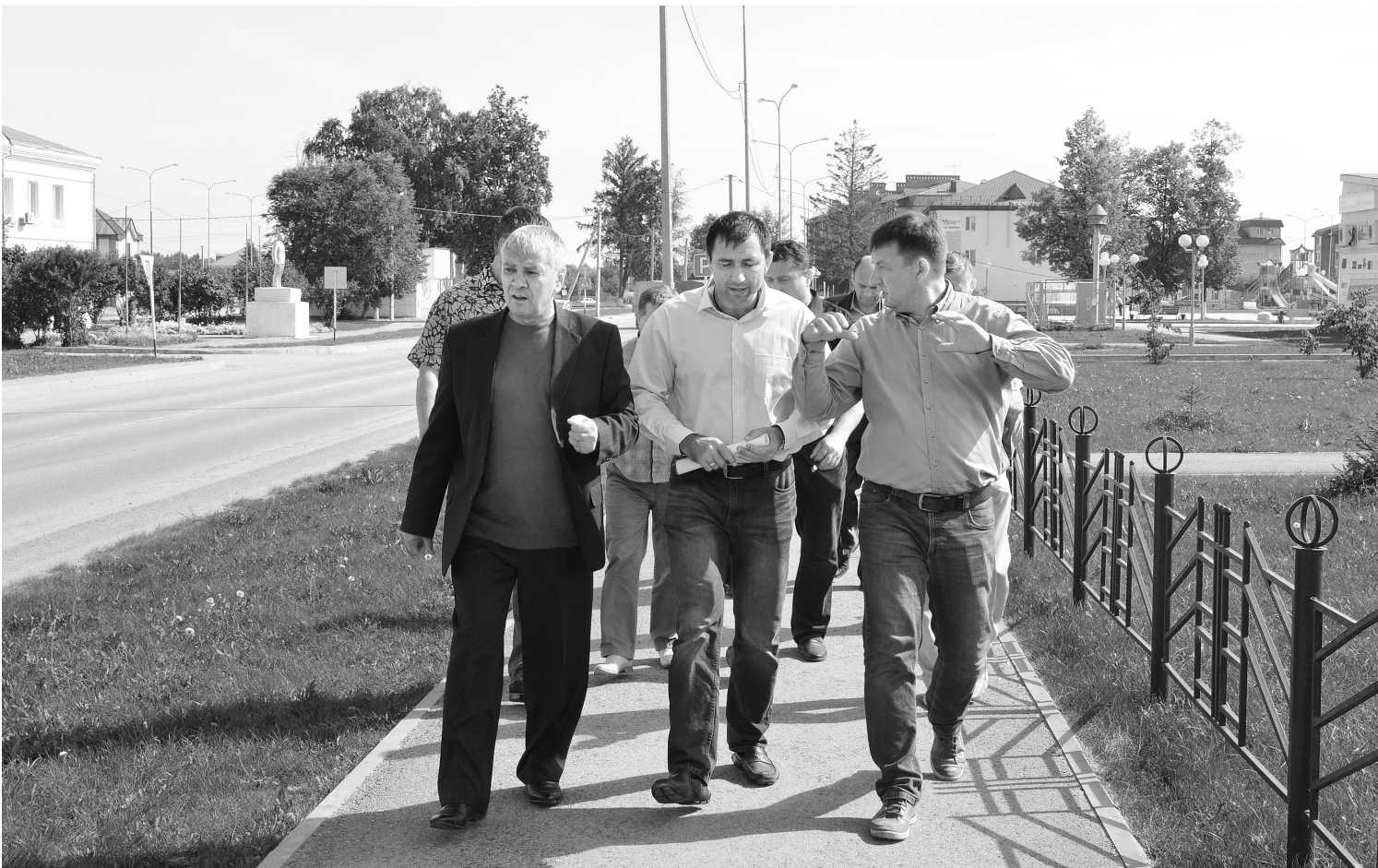
Многие хотят перенять у нижнетавдинцев.