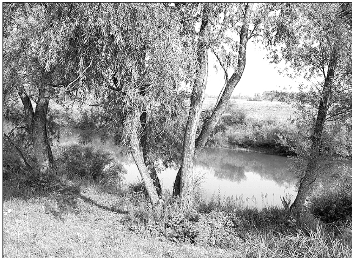
И всех земных богатств дороже родная Родина моя...

– Живи честно, иди к людям с добром и любовью, и по заслугам тебе воздастся, – эта фраза лентой проплыла перед глазами, заканчивалась и снова начиналась. Как просто, доступно и как верно звучат эти слова: «И по заслугам