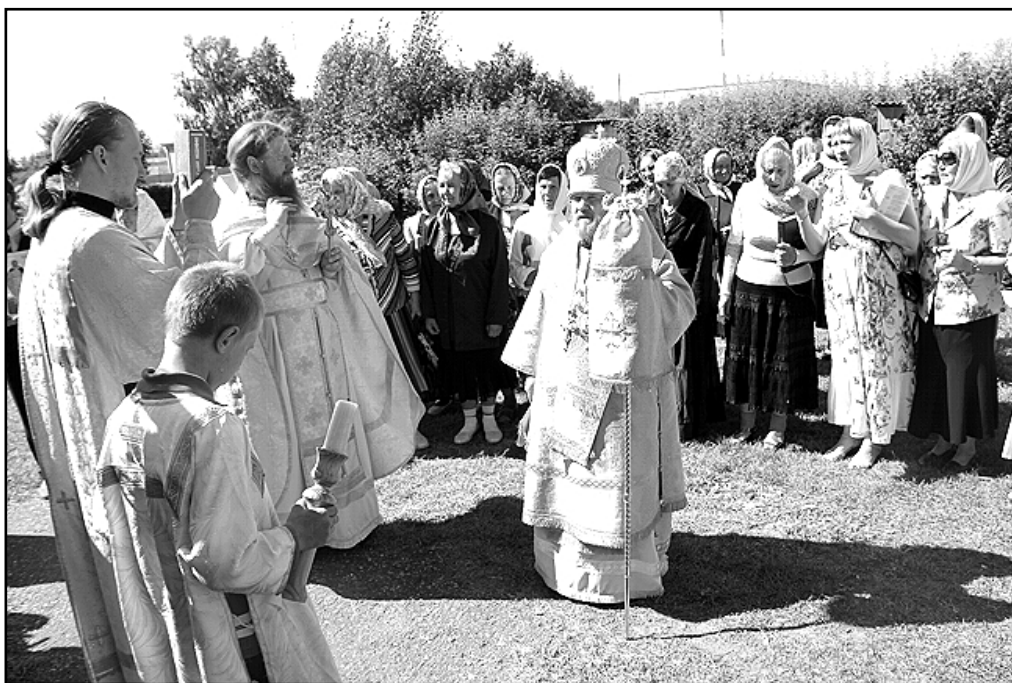
Епископ Тихон возглавил совместную молитву в Ильин день