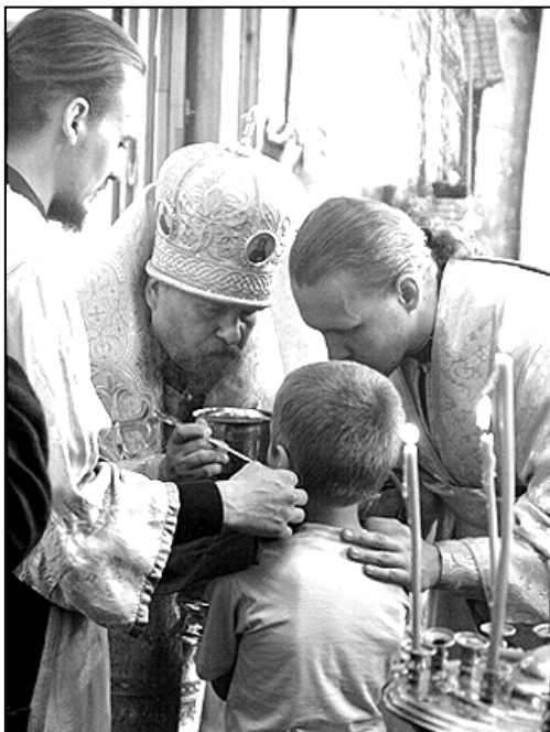
«Причащается раб Божий Телу и Крови Христовым...»