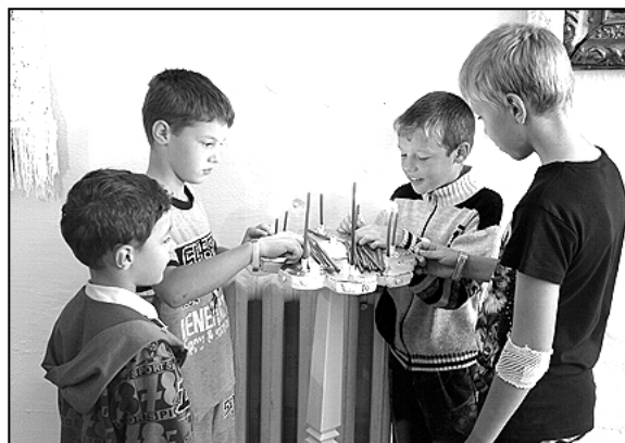
«Пустите детей приходить ко мне!»

– Следующее воспоминание – из школьных лет – это где-то шестидесятые годы. Мы