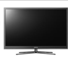
Автомобилотоллы, Видеорегистраторы, Телевизоры акустика, сабвуферы, навигаторы.

Услуги горизонтально-направленного бурения Vermeer +7 3452 490467. Услуги (аренда) погрузчика-экскаватора JCB +7 3452 586304. Пневматическое, компрессорное и вакуумное оборудование +7 3452 490490. Интернет-магазин: http://technician72.ru/ +7 3452 601 627, +7 929 269 16 27.