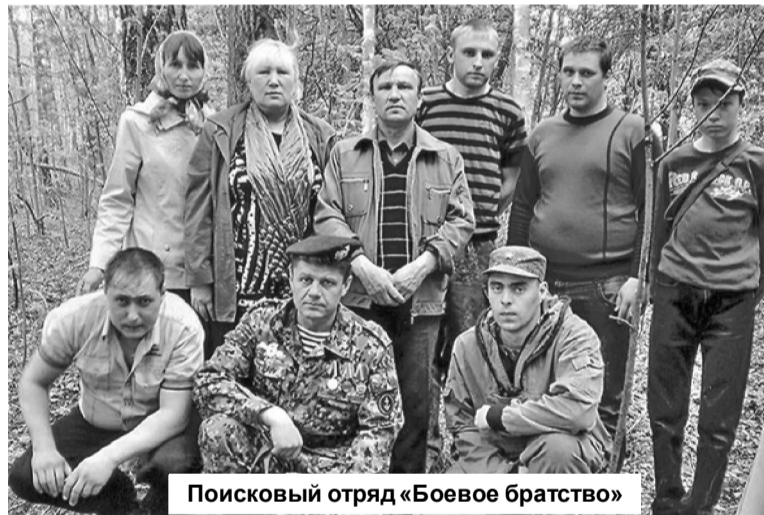
Поисковый отряд «Боевое братство»