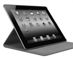
Планшеты с 3G