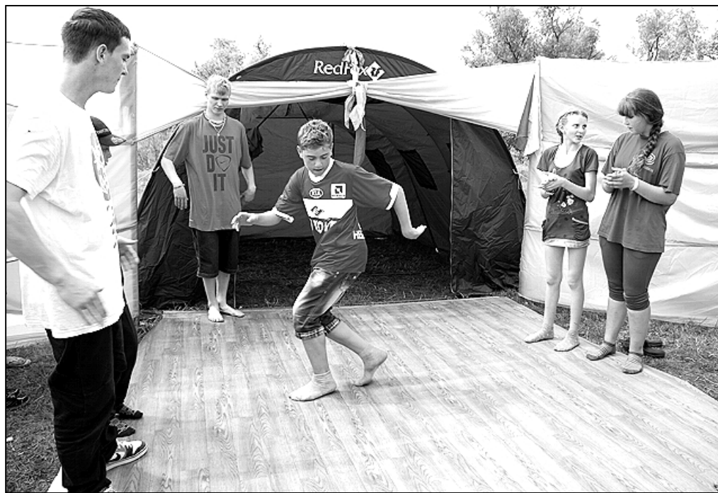
Новые современные танцы разучивали подростки на отдыхе в Боровлянке

Если для детей летние месяцы — это сплошной праздник, то для взрослых — пора ответственной работы по организации детского летнего отдыха. О том, как отдыхали дети Казанского района, обозреватель газеты Тамара Носкова беседует с начальником управления социальной защиты населения Н.А. ШАЛЬНЕВОЙ.