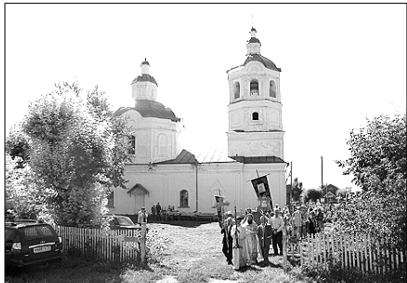
Крестный ход в Ильинке