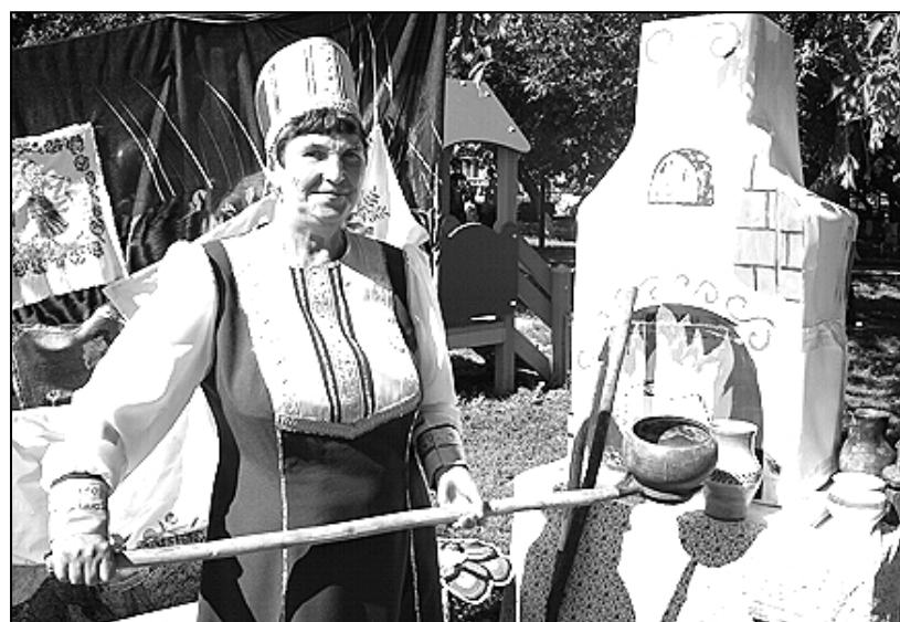
Русская печь на протяжении веков была кормилицей