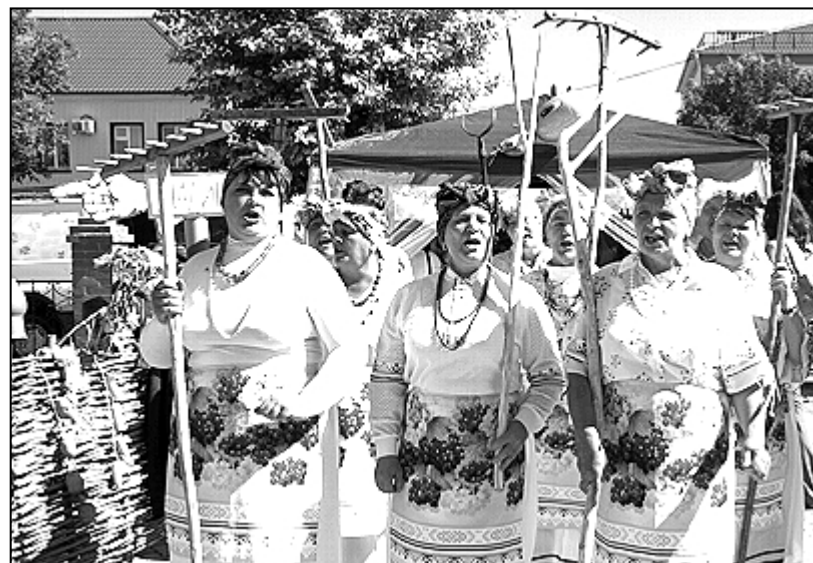
Новоселёзовцы подготовили сцену из «Свадьбы в Малиновке»