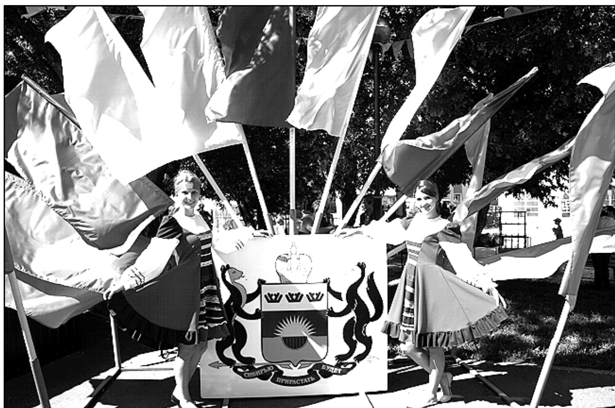
Герб Тюменской области – неперенный атрибут праздника

А на сцене тем временем появился народный вокальный коллектив «Русская песня» Казанского районного дома культуры с песней о родной земле. На этот раз у