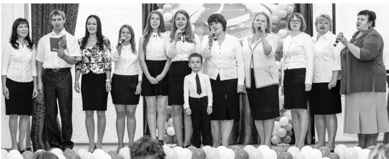
Музыкальный привет педагогам города от лица им. Е.Г. Лукьянец.