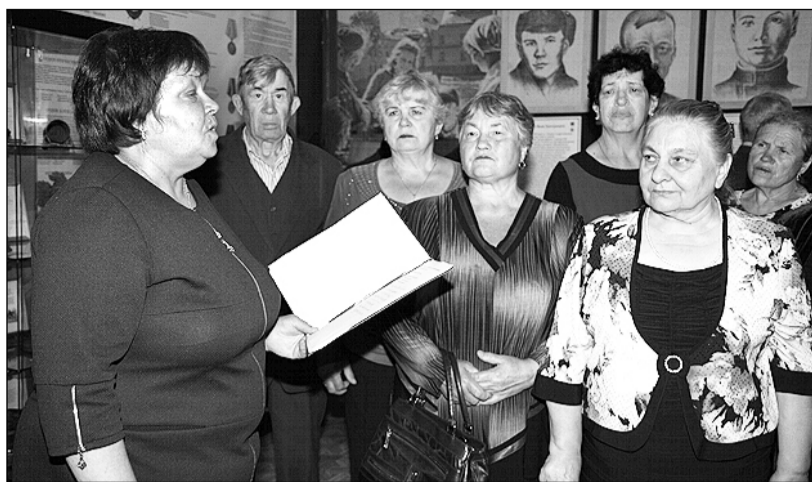
Во время встречи в музее