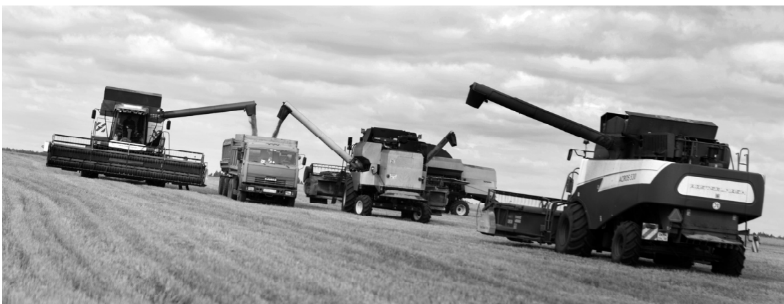
Страда-2014 в разгаре