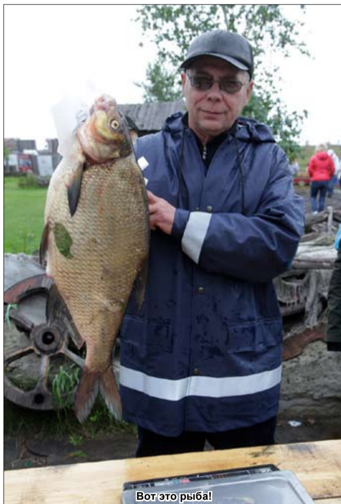
Вот это рыба!

Четверг, 11 сентября 2014 г. № 73 (7691) Цена 7 руб. 54 коп. Основана в 1962 г. http://www.tyumedia.ru/20/ , http://sovetsib.ru