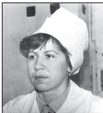
Первые годы работы

— Как правило, люди, пока не заболели, не осознают необходимость сбережения Богом дарованного драгоценного дара.