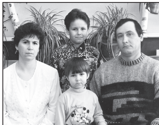
Семья – это радость