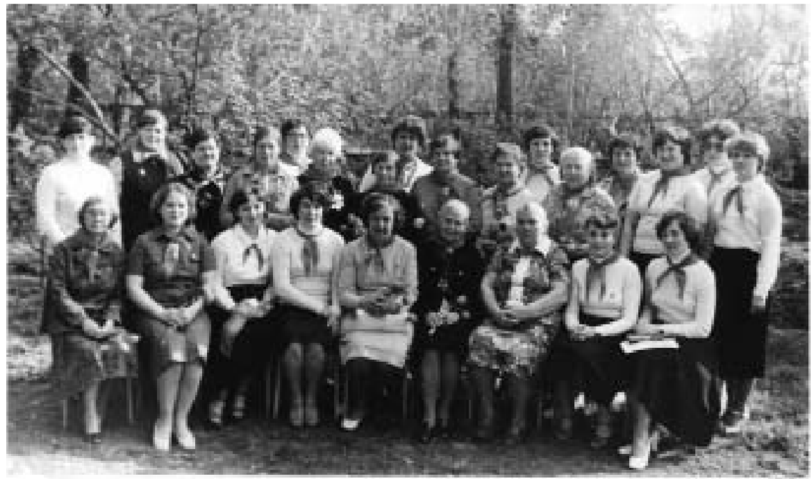
Комсомольский актив – пионерские вожаки в саду Ермака (1982 г.).

Лекторская группа, которую предложено возглавить ветерану