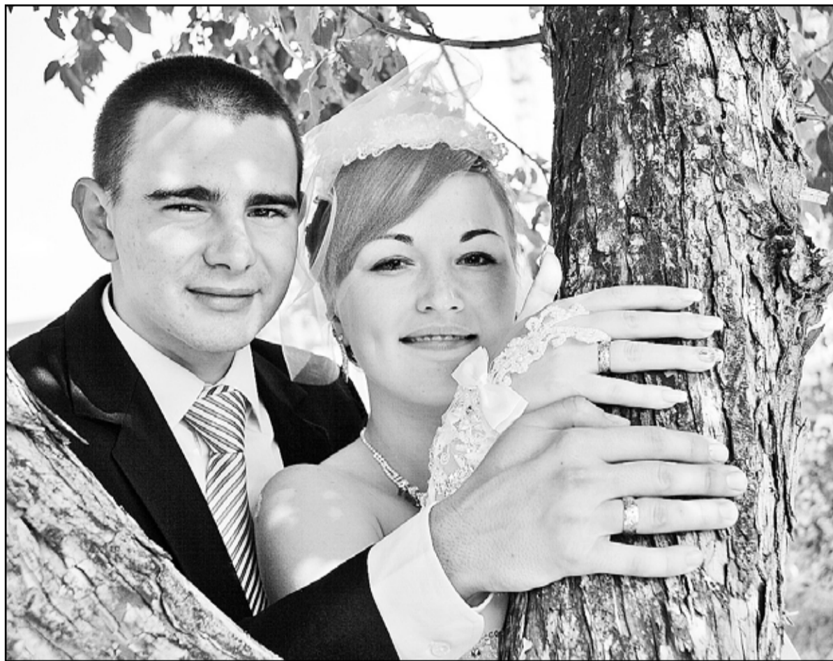
Осень – пора свадеб