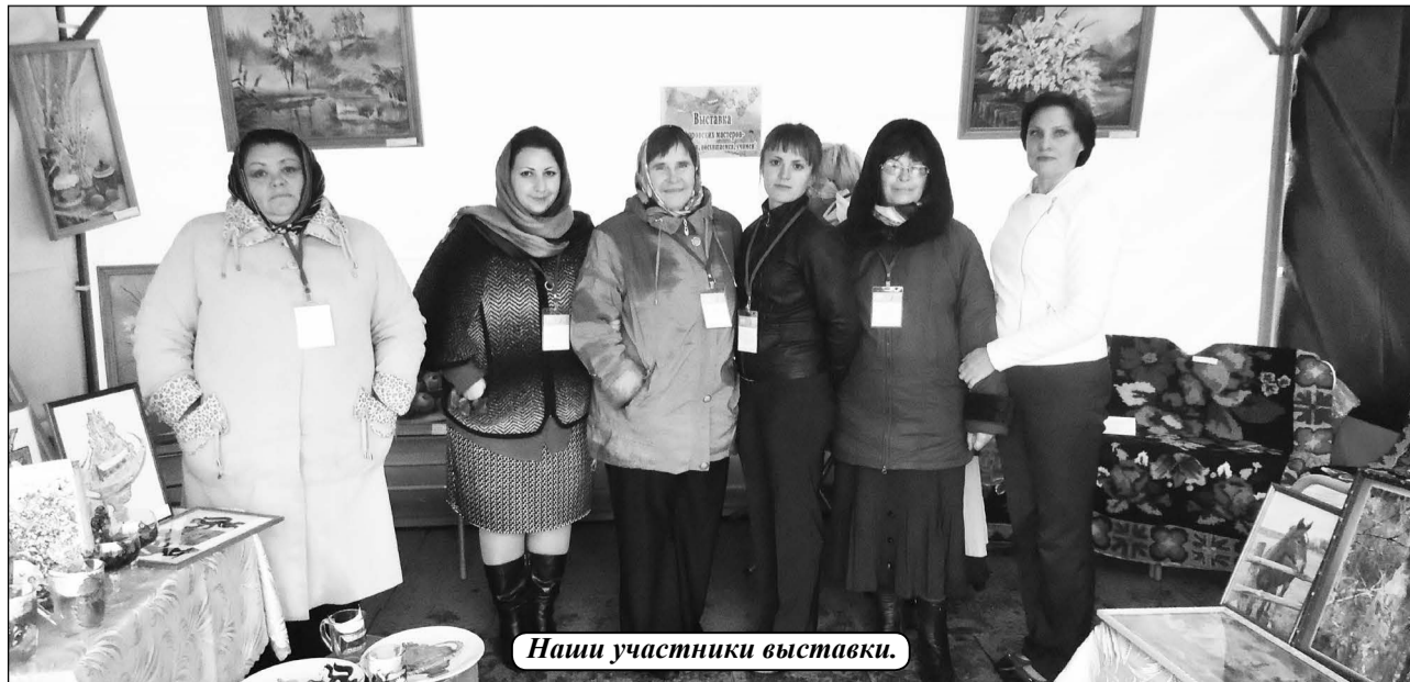
Наши участники выставки.