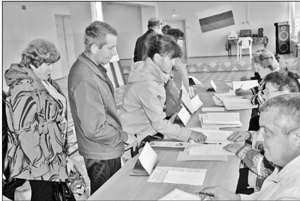
Выборы в Больших Ярках – это праздник и рекорды явки населения

О, если бы все понимали, что выборы могут быть таким светлым, весёлым и дружным праздником, то смена власти происходила бы только так. Не ночью, в чаду жжёных покрышек, насилия и яростной вражды, а солнечным днём, когда плечом к плечу с самыми близкими людьми народ цивилизованно и открыто выражает своё, демократичное, мнение.