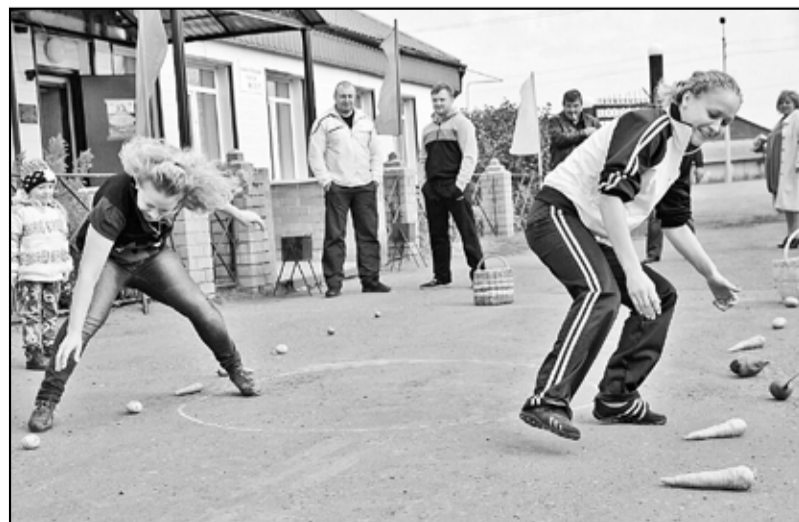
«Весёлые старты» в ветстанции повеселили и взрослых, и молодёжь