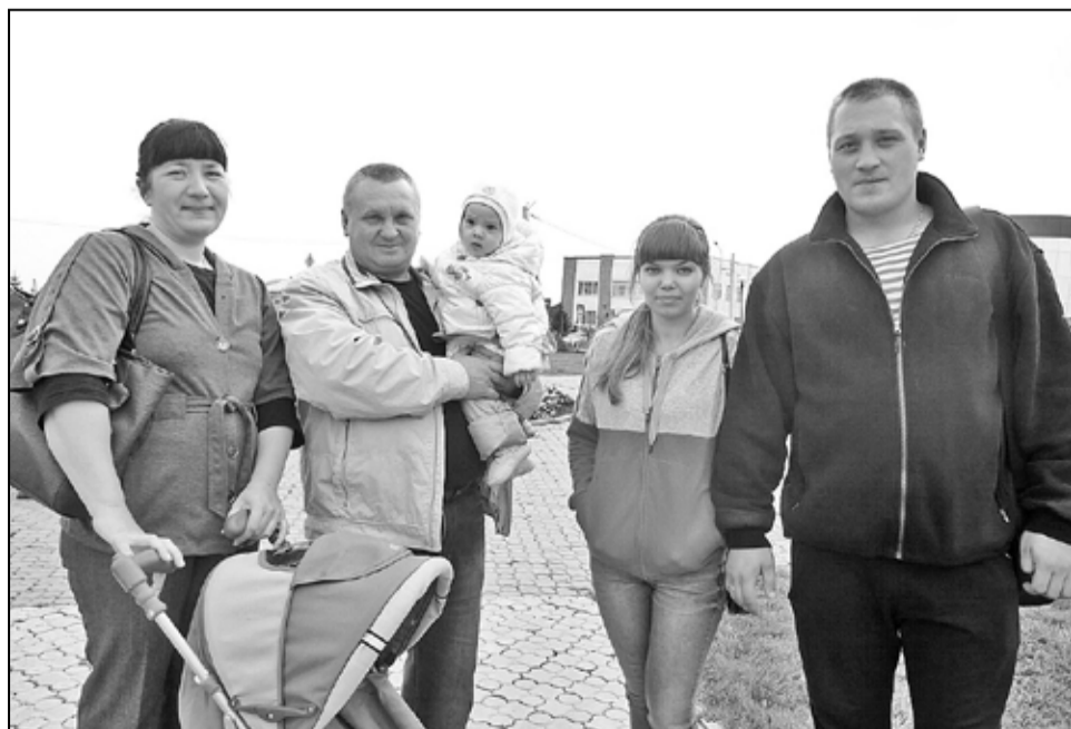
Каждый из семьи Бессоновых охотно отдал свой голос за губернатора

Нина РОСТОВЩИКОВА