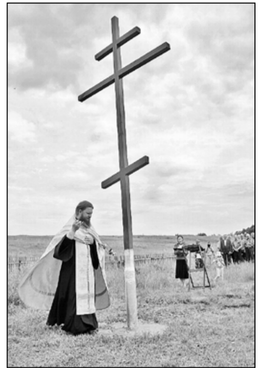
Воздвижение Креста Господня над Ченчерью

Горячо желая отыскать Крест, на котором был распят Господь, он