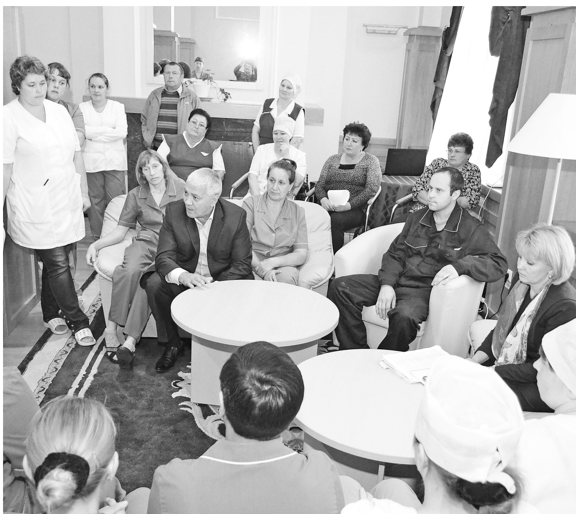
Каждому было интересно знать, какие перемены ждут «Ахманку».

Главная задача на сегодняшний день – расширение центра восстановительной медицины и реабилитации «Ахманка».