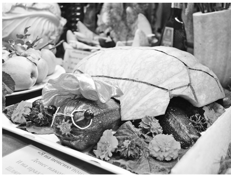
Эта чудо-черепаха — творческая находка ветеранов Пенсионного фонда.