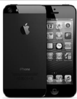
Смартфоны, сотовые телефоны

с. Вагай, ТЦ Южный, 1 этаж ул. Ленина, 16А тел. 23-1-16