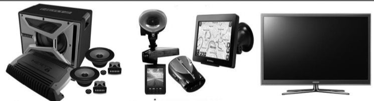
Автомобильные магнитолы, Видеорегистраторы, Телевизоры акустика, сабвуферы, навигаторы.

ПРОВОДИМ ОТОПЛЕНИЕ в домах с установкой котлов электрических, газовых и на твердом топливе. Телефон 89044637831.