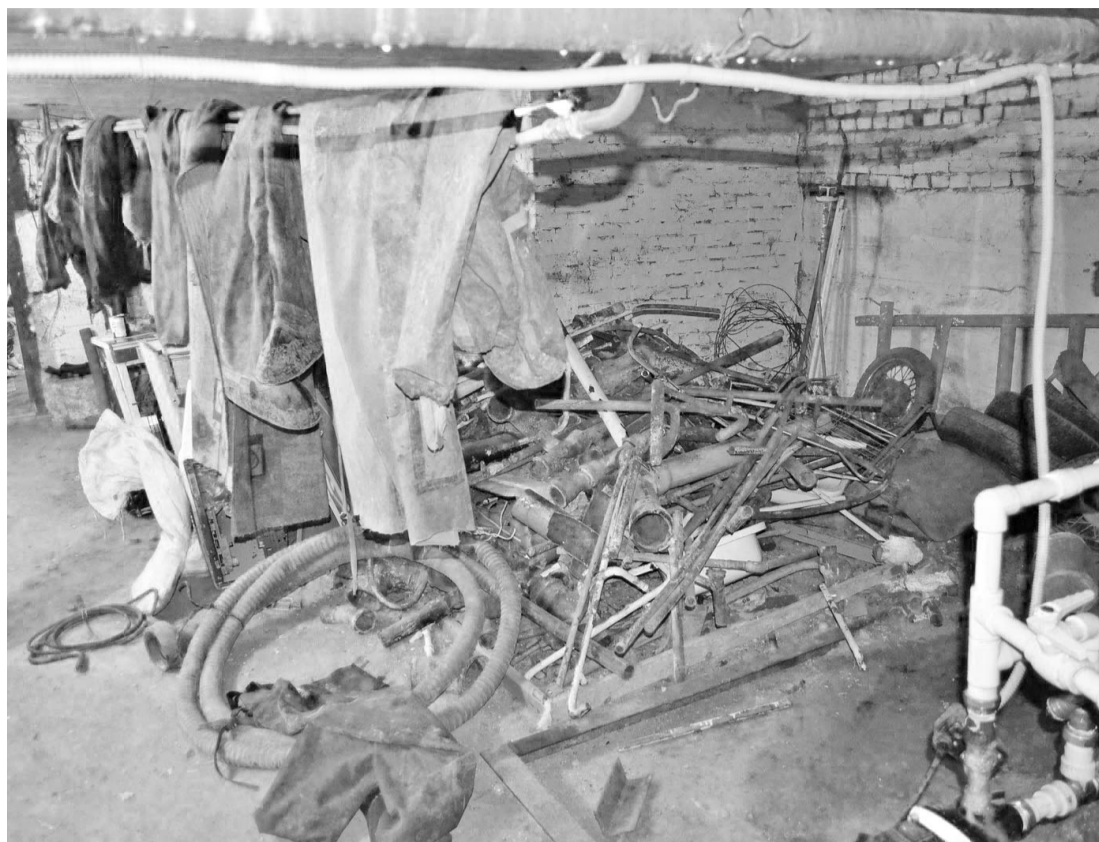
Подвал трёхэтажки, метром выше – жилая квартира, где едят, спят, где бегают дети...