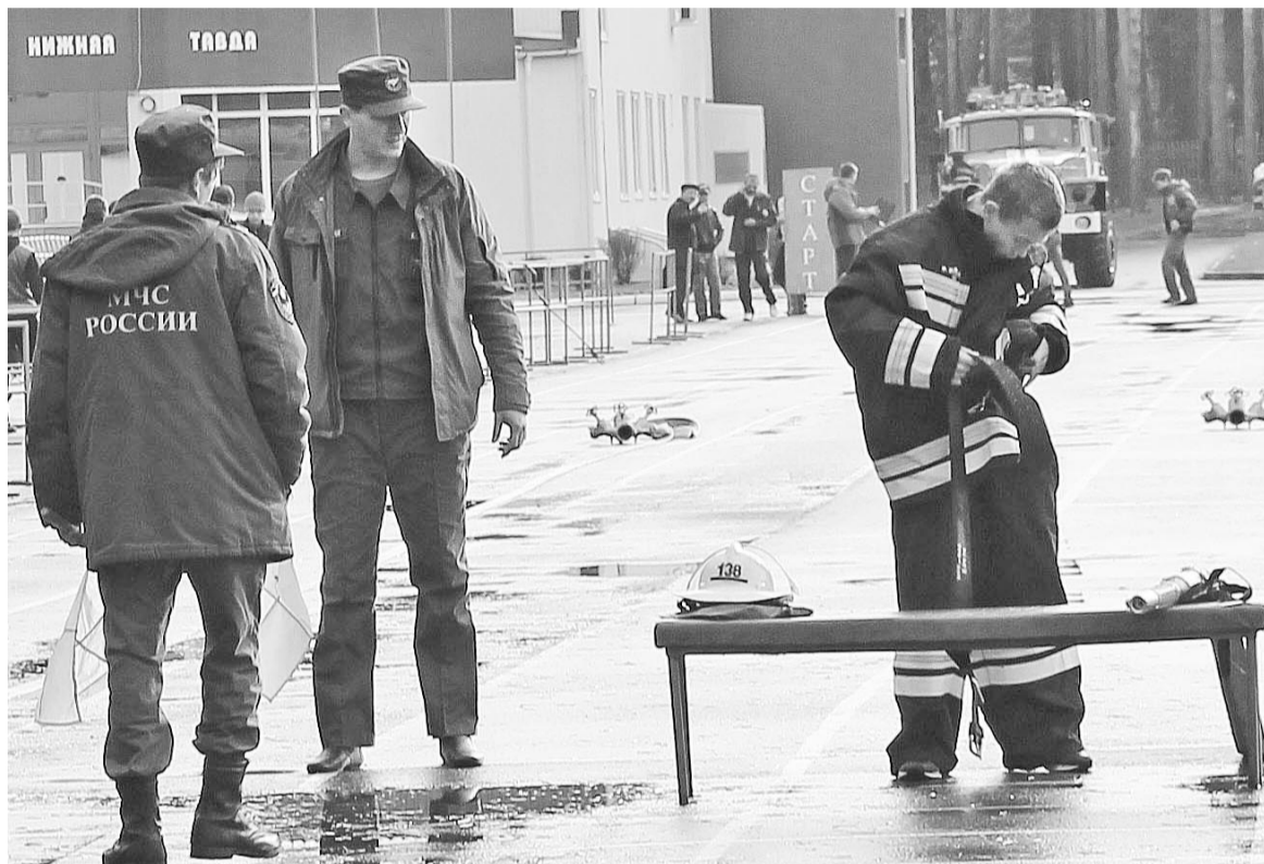
На одном из этапов соревнований – надевание формы.

Ребята действительно выкладывались по полной, стараясь на каждом этапе соревнований (соединение рукавов, надевание формы, тушение огня и перенос пострадавших) быть лучшими. Всё это учитывалось