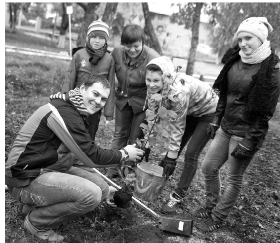
Здесь будет сад!