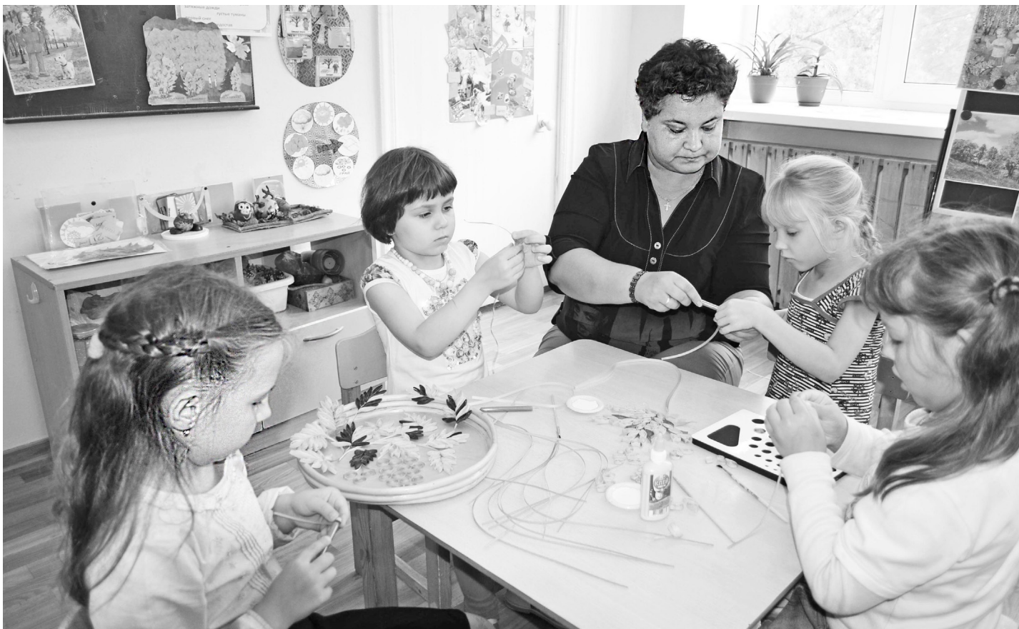
Малыши с усердием создают такие интересные вещи.

Переступая порог детского сада, мы словно попадаем в другой мир, безмятежный и полный радости и смеха детей. Здесь всё вокруг наполнено атмосферой любви, добра и понимания. Здесь помогают нашим деткам познать мир прекрасного, мир творчества.