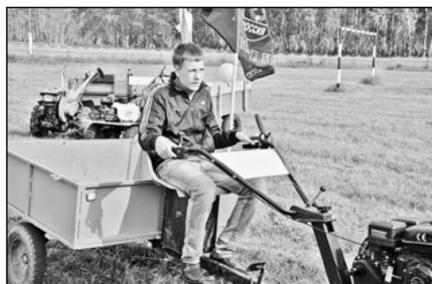
На мотоблоках можно не только работать