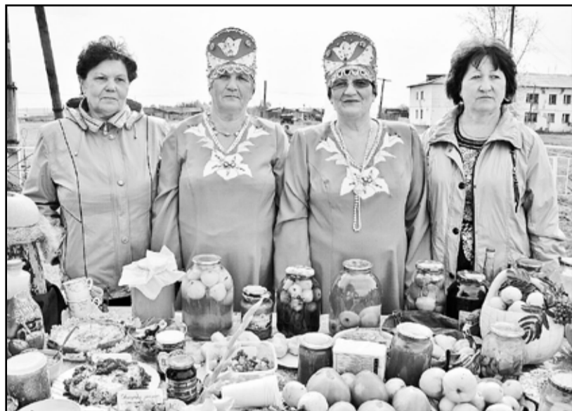
На выставку «Сад и огород» хозяйки принесли всё самое вкусное