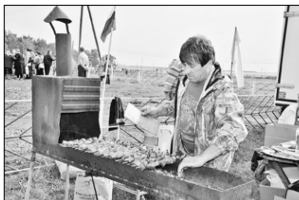
Шашлычки понравились всем