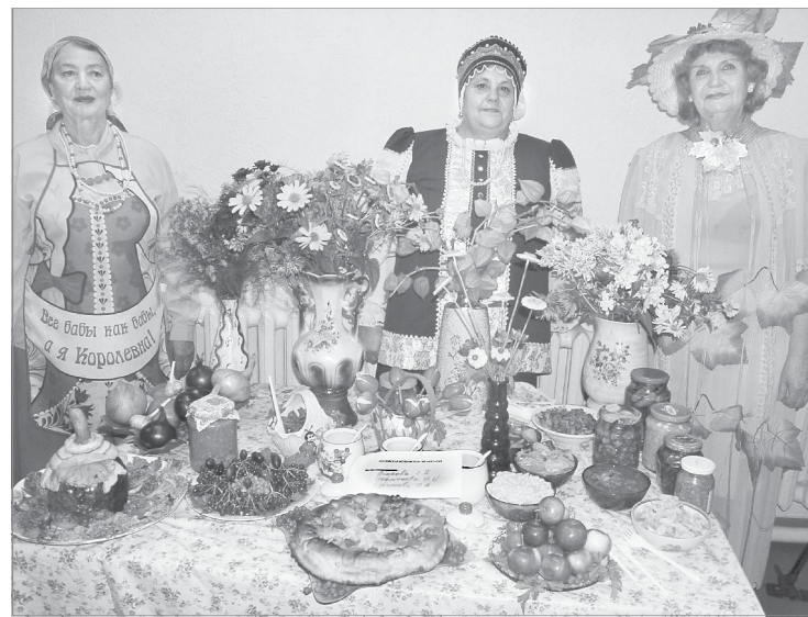
Всё умеют наши ветераны!

Очень теплой и душевной получилась концертная про-