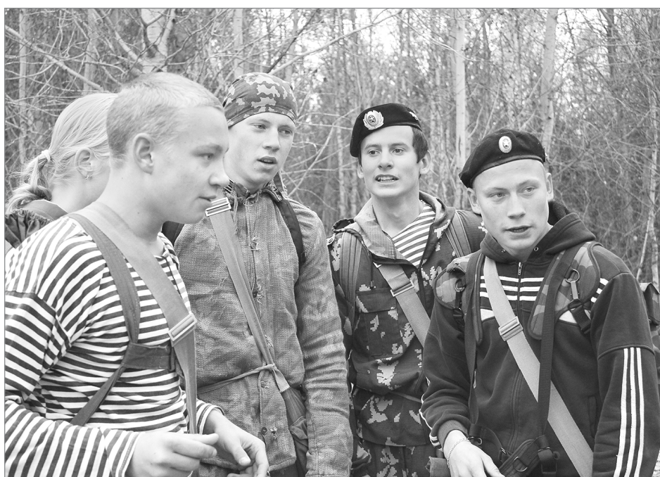
План дальнейших действий таков...

Победители и участники отмечены дипломами администраций города и района, сертификатами и подарками.