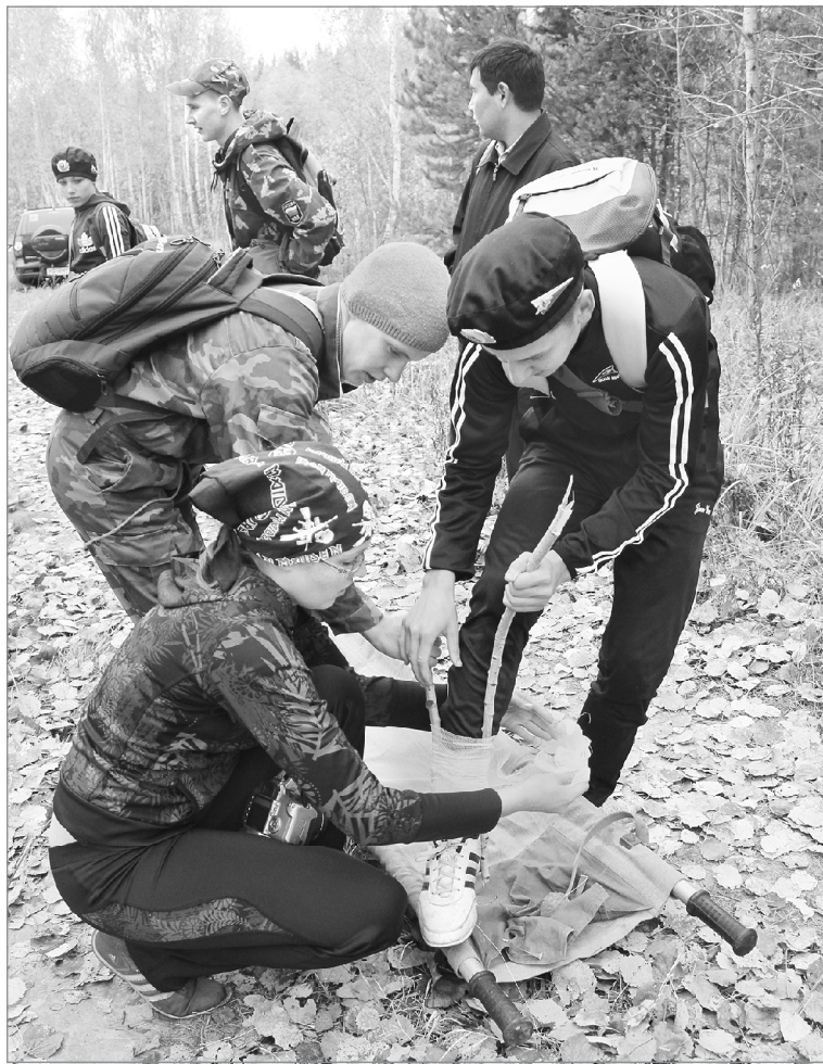
Главное - правильно наложить шину