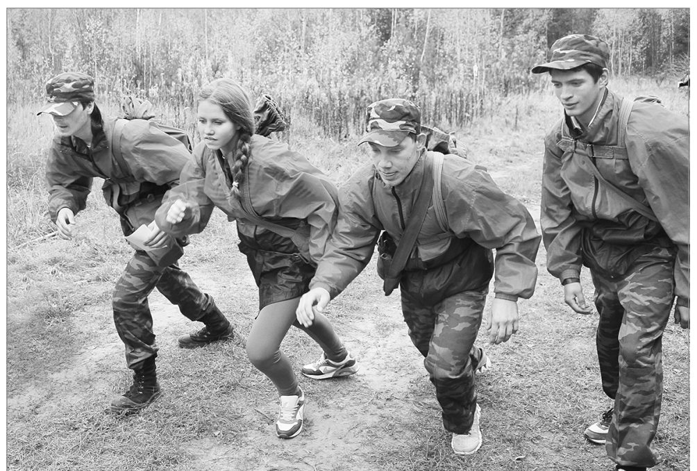
На старт! Внимание! Марш!