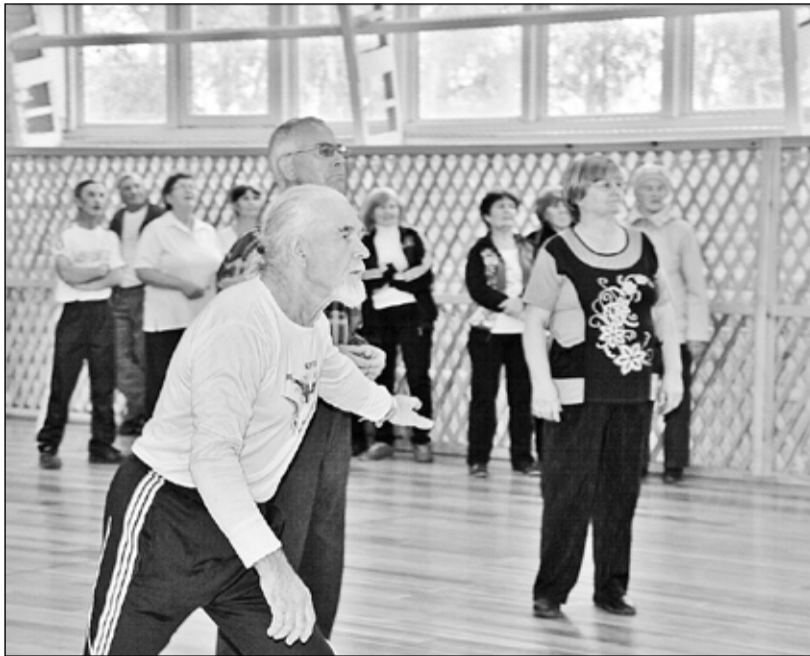
Игра в пионербол была захватывающей

Ставшая в последние годы традиционной спартакиада пожилых людей состоялась в Казанском уже в седьмой раз. Причём с каждым годом число её участников растёт. Нынче на спартакиаде пожилых побывало около двухсот человек – участников и болельщиков.