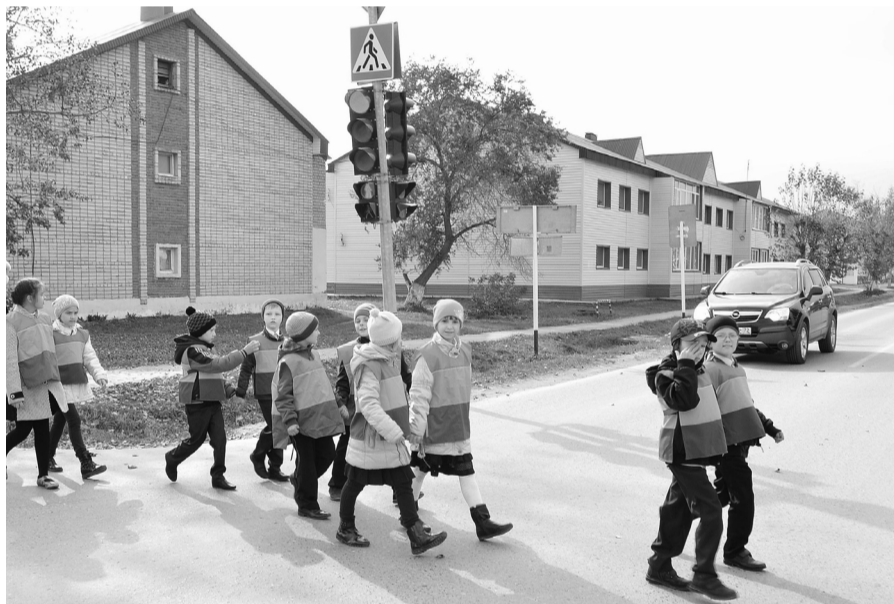
На пешеходном переходе.

Для некоторых водителей, например, пешеходная зебра – не аргумент, другой может просто не заметить красного сигнала светофора... В общем, всем нам надо быть осторожнее. Во всяком случае, при переходе дороги ваши действия должны быть чёткими и понятными для водителя. Не делайте лишних движений, ни в коем случае не перебегайте проезжую часть.