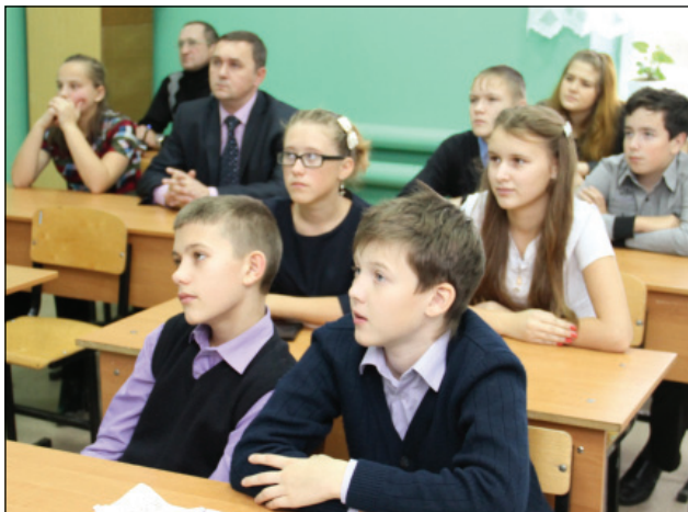
• Школьники внимательно слушают практиков сельскохозяйственного производства.