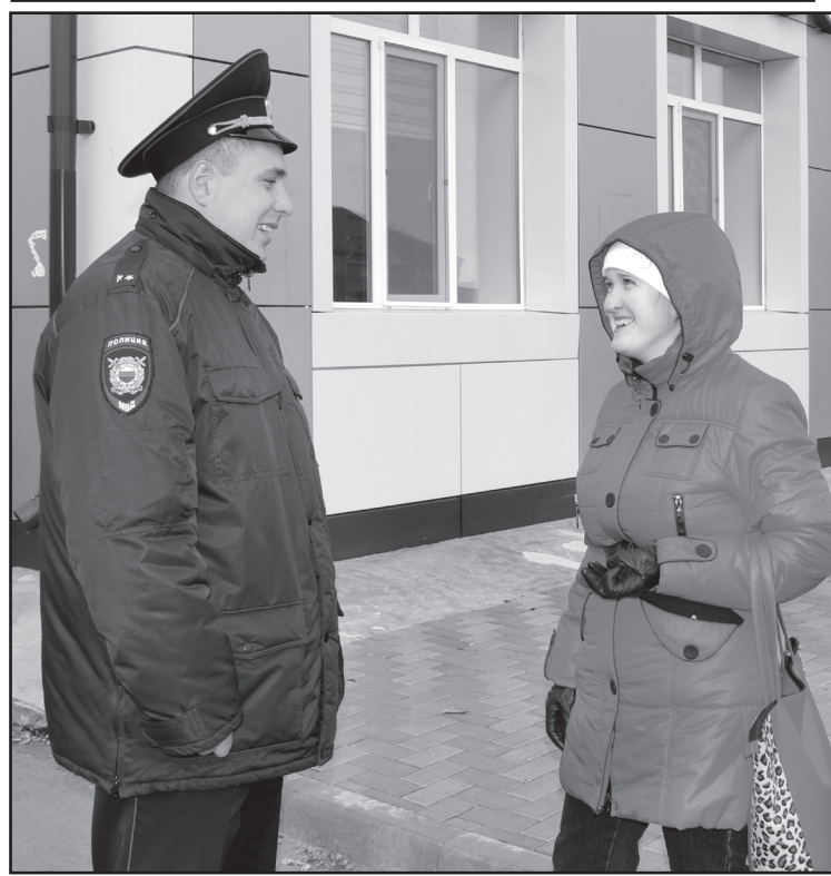
Работа с населением

юсь оперативно выезжать. Люди обращаются ко мне и на улице: кому-то нужна консультационная юридическая помощь, кто-то сообщает о происшествии, кто-то жалуется на шумных соседей.