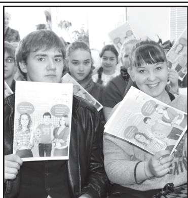
На уроке пенсионной грамотности