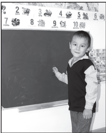
Готовлюсь к школе