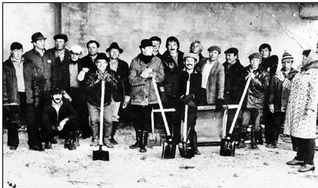
Коллектив автоколонны на субботнике. 1980-е годы

Помогали «доводить до ума» автомобили в мастерских, которые методом народной стройки были сооружены из подручных материалов в первые годы самим коллективом. Стены саманные, перекрытия деревянные, кровля из рубероида. Здесь располагались кузница, сварка, токарный, аккумуляторный, медницкий, моторный, вулканизаторный цеха, ямы техобслуживания, тёплые стоянки для ремонта. А какие спецы здесь работали: И.М. Клей-