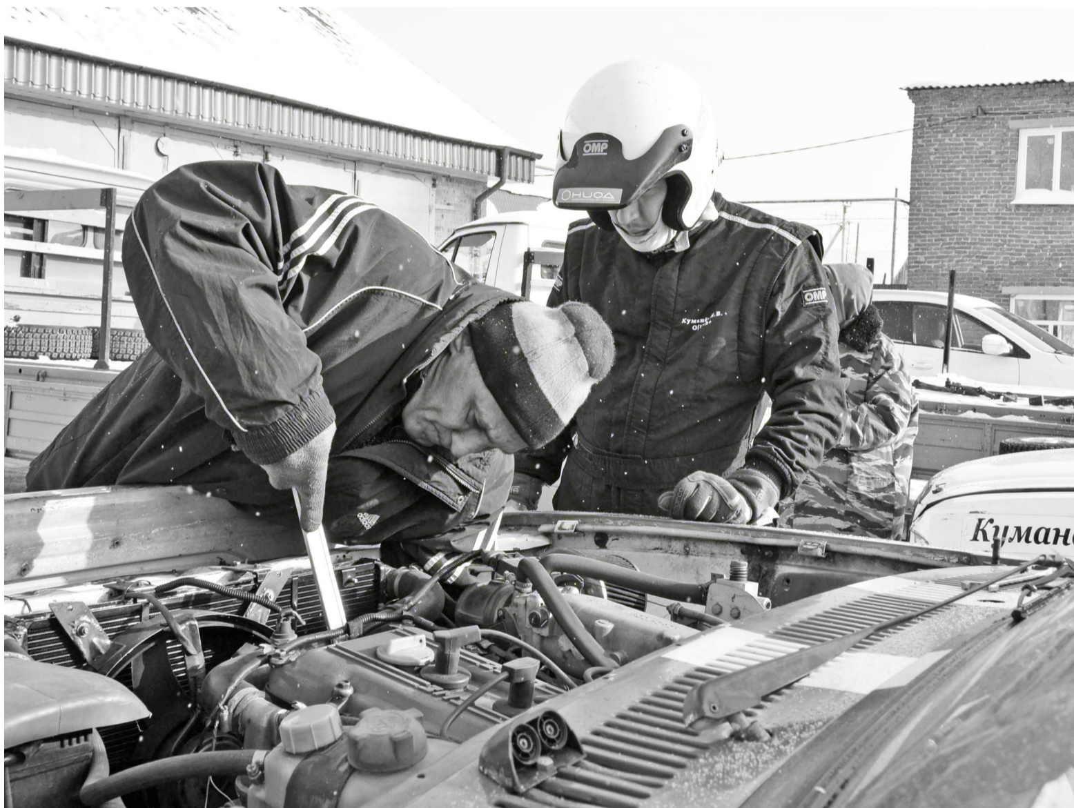
Ремонт на ходу. На всё и про всё 15 минут.

Второй год подряд Нижняя Тавда накануне профессионального праздника работников автомобильного транспорта встречает лучших гонщиков – участников второго заключительного этапа первенства Тюменской области по автокроссу среди автомобилей класса Д2-2500 и Д2-1600.