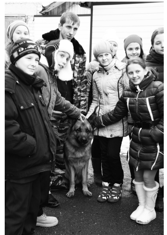
• Встреча с четвероногим «сотрудником» полиции псом Мишей вызвала у ребят полный восторг.

Конечно, организаторы экскурсий не задавались целью сиюминутно сориентировать школьников в выборе специальности, но, тем не менее, среди старшеклассников нашлись и такие, кто, закрыв дверь предприятия, сказал: «Да, я буду поступать в учебное заведение этого профиля!». К примеру, пятеро юношей подтвердили своё желание учиться в Уральском институте МЧС Рос-