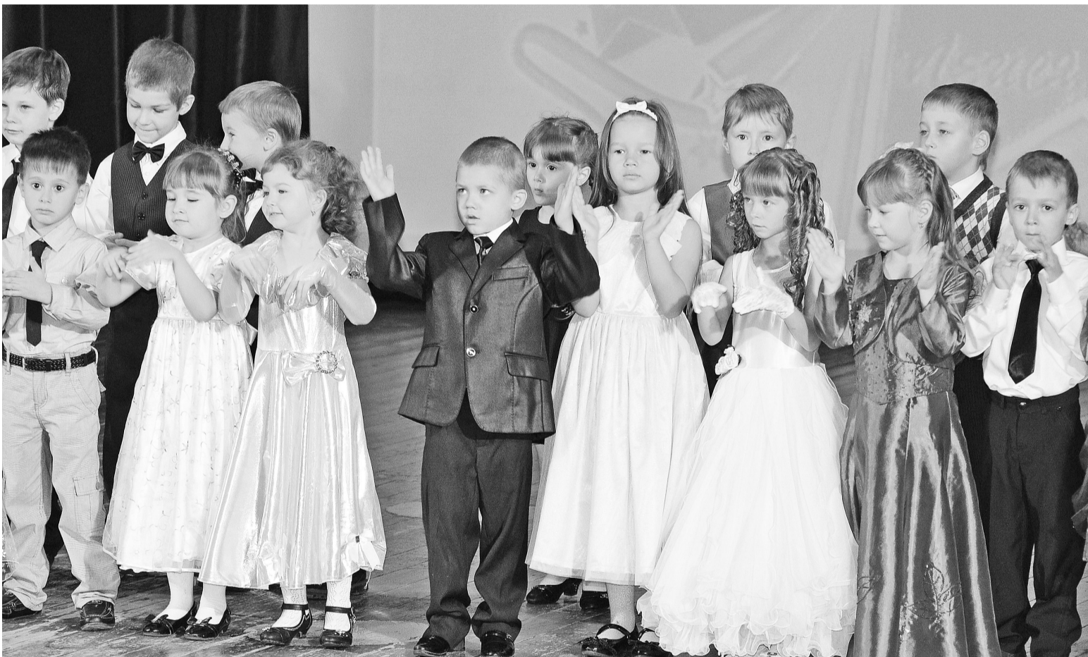
Сводный хор «Зёрнышко» Нижнетавдинского детского сада «Колосок» отмечен специальной номинацией за яркое выступление.

Люди часто говорят, что поют птицы или поёт ветер. Но на самом деле пение – это то, что присуще только человеку. Возможность заниматься вокалом дарована нам самой природой. И такой щедрый дар необходимо тщательно и целенаправленно развивать с детства. А потом делиться им со зрителями на традиционных конкурсах.