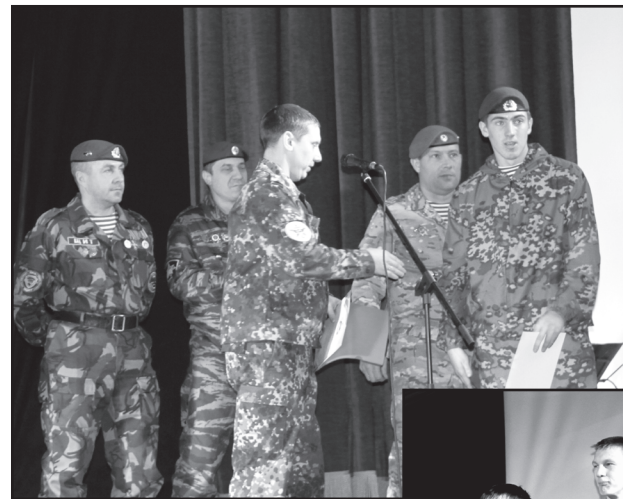
Шевроны — лучшим

Волнующий и трогательный момент для призванных. Здесь было место серьёзным напутствиям, лирике и доброму юмору. Зал взрывался от смеха от рекламных проспектов ведущих: «Туристическая фирма «Военкомат» приглашает вас в удивительное путешествие в любую точку страны, сроком на один год. Вы сможете посетить экзотические места: Крайний Север, Дальний Восток, тайгу Сибири, горы Кавказа. Во время путешествия вас ожидает бесплатное проживание в пятизвёздочном