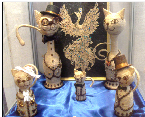
Наталья Ососова в своём творчестве использует разные техники и материалы.

забудки, фиалки, анютины глазки, примулы, хризантемы, подснежники. В редких случаях мастерица использует для украшения своих изделий купленные элементы декора. Даже тычинки в цветах сделаны ею.