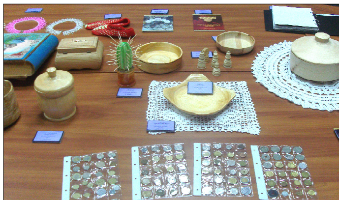
Разнообразие изделий декоративно-прикладного творчества (с. Демьянское).