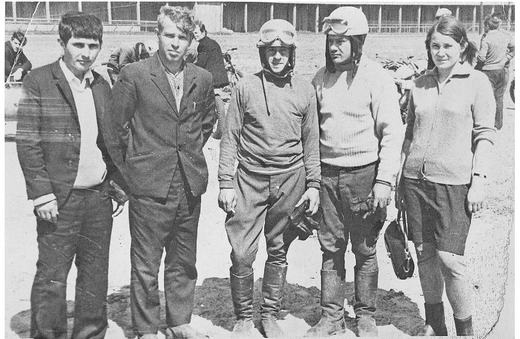
1968г. Та самая команда нижнетавдинских мотогонок, что пользовалась заслуженным авторитетом и даже побеждала на областных соревнованиях.