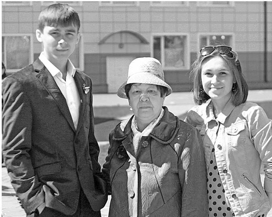
Внуки бабы Веры.

Моя бабушка всегда была нужна людям, так как постоянно вела общественную работу: была проформом,