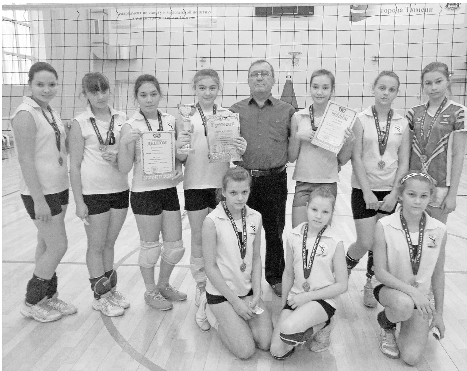
Десятка классных спортсменок со своим тренером.

Повод порадоваться за наших юных спортсменок самый подходящий: в первенстве Тюменской области по волейболу среди девочек 2002 года и младше нижнетавдинки заняли I место! Наши повергли команду Тюмени (они на втором месте) и команду Ялуторовска (на третьем месте). Сильные волейболисты из Заводоуковска и Голышманово не дотянули до призового места. Девочки привезли домой кубок победителя, медали и премию по 800 рублей каждая.