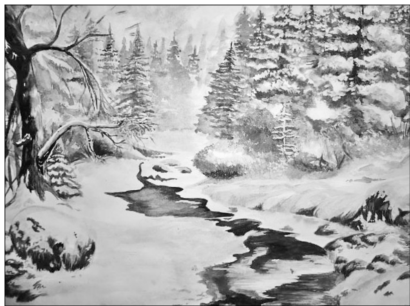
Зимний пейзаж. Акварель