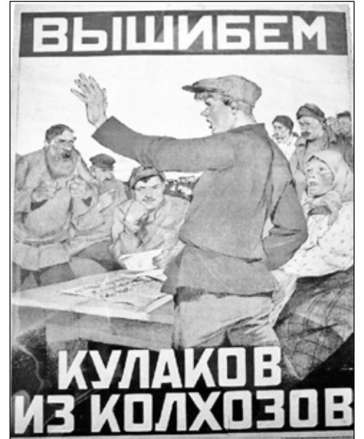
Агитплакат времён коллективизации