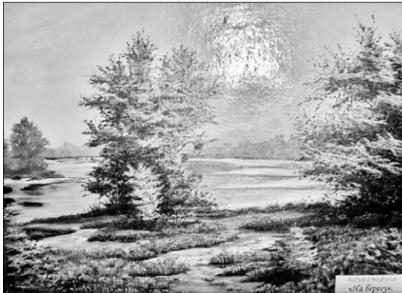
Картина Вадима Стифунина «На берегу»