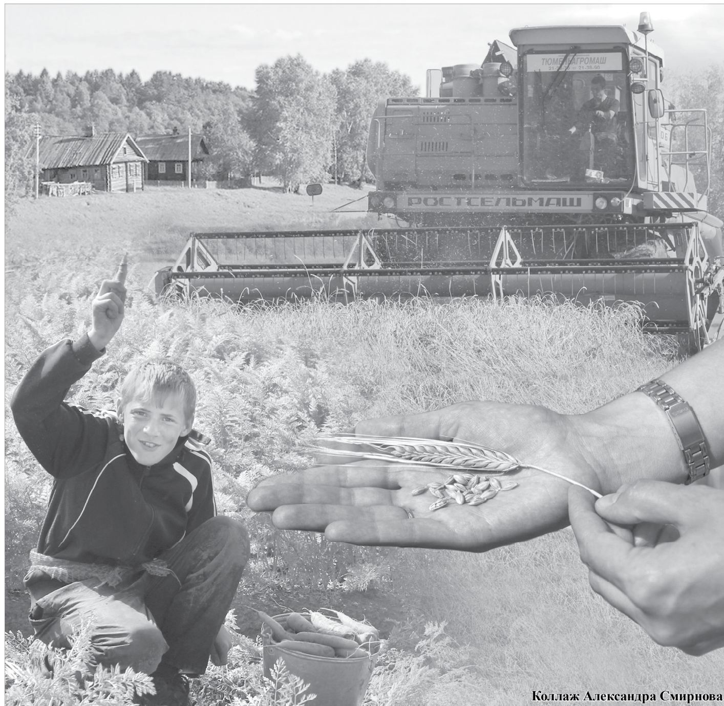
Коллаж Александра Смирнова

Уважаемые труженики сельского хозяйства! Жатва-2014 - уже история. Когда в районе начинается важная кампания, у земледельцев появляется немало сомнений и тревог, ведь из-за особенностей сибирского климата неспроста нашим краям присвоен статус зоны рискованного земледелия.