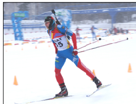
бик пришел седьмым.