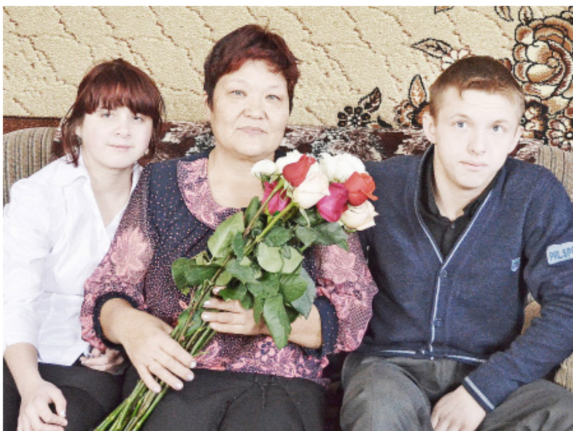
Самые родные люди на свете.

В доме Загидуллиных светло, просторно, как-то домашнему. Очень много растений в каждой комнате, розы еще не увяли (юбилей 18 ноября отмечали всей большой семьёй). И во дворе всё по-хозяйски. Жаль, что летом здесь не побывали, когда цветы благоухали всюду: на огромной клумбе, обнесённой плетнём, в вазонах, кашпо и различных приспособлениях. Семья заняла второе место в районном конкурсе на