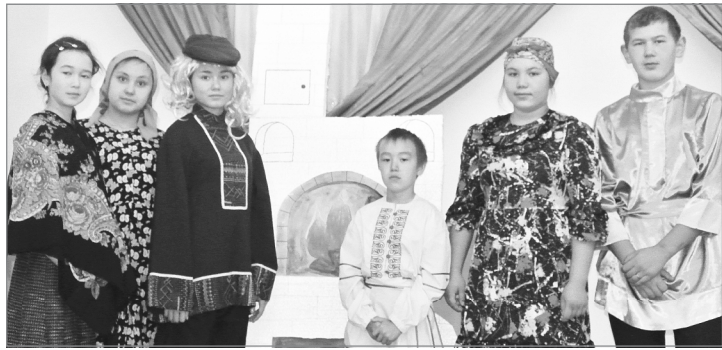
Действующие лица спектакля

С благодарственным письмом областного департамента образования и науки и подарком - набором микрофонов вернулись яровские школьники с финала регионального фестиваля театральных постановок «Премьера-2014», проходившего в рамках Года культуры.