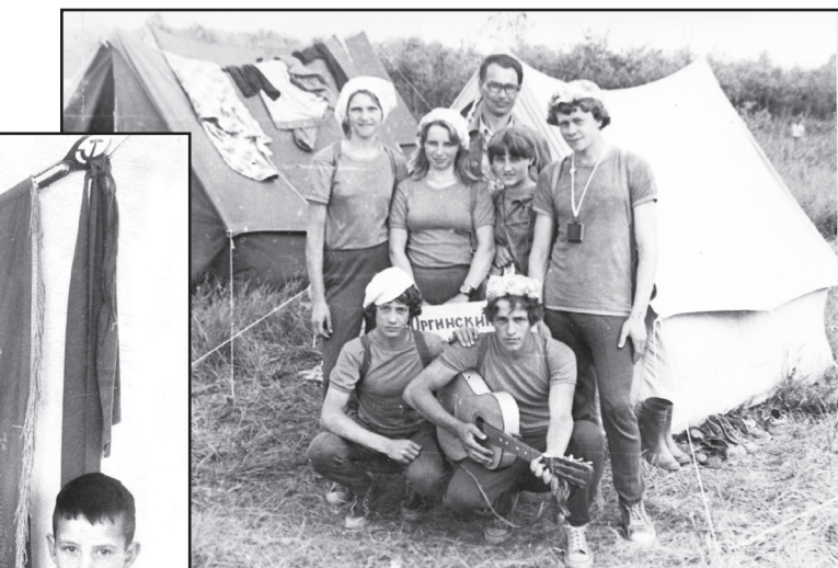
Областной турслёт, 1981 год