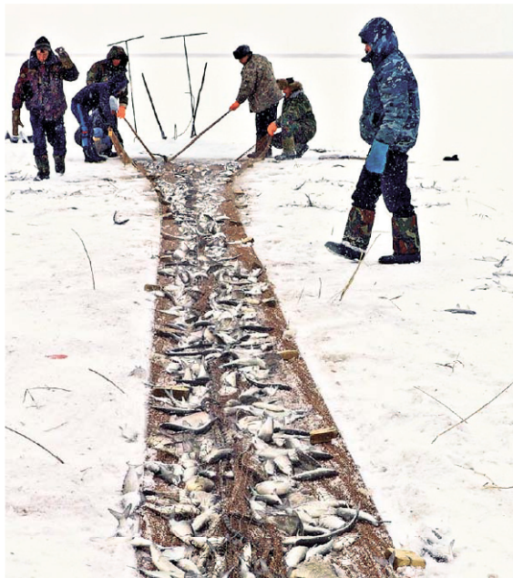
Зимняя тяга в Армизонском районе.

За примерами далеко ходить не нужно. На рыбозаводе