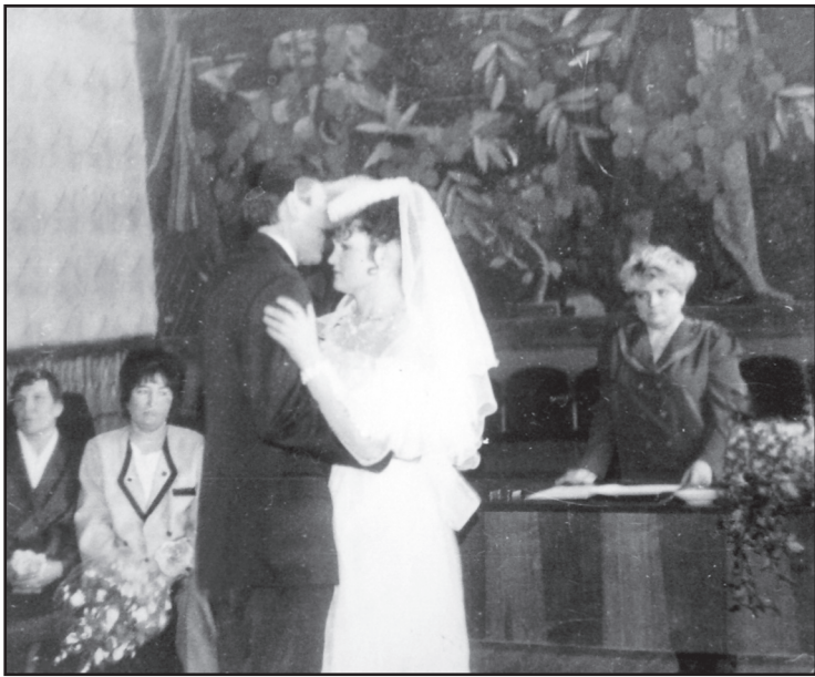
Торжественная регистрация брака

Выдача свидетельства о рождении малыша хотя и не была столь волнительна, но ответственности требовала