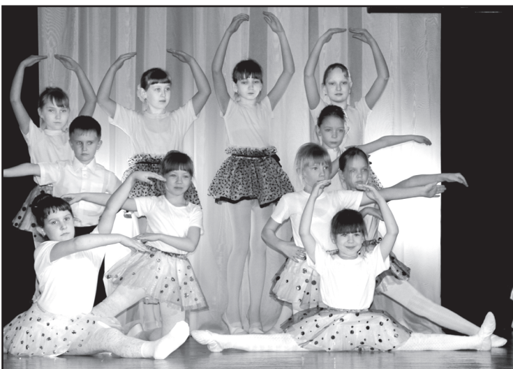
Танцевальный номер — в подарок