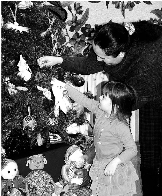
Дети от старых советских игрушек в восторге - сейчас таких нет.

После выхода в 1936 г. фильма «Цирк» с Любовью Орловой в моду вошли игрушки, изображающие