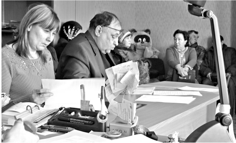
• В создавшейся ситуации «разбирался» вместе с собравшимися и Винни Пух, хотя ему пришёлся по вкусу второй вопрос в повестке собрания ТОСа – подготовка к Новогодним праздникам.

Изменения в оплате за коммунальные и жилищные услуги – первый и главный вопрос повестки заседания территориального общественного самоуправления, состоявшегося на прошлой неделе в Новой Заимке.