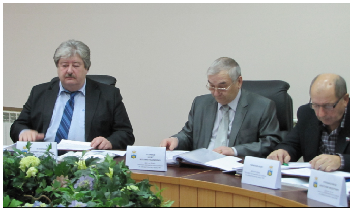
Депутаты Думы Уватского муниципального района за работой.