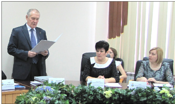
Награждение Почётной грамотой Думы Уватского муниципального района.