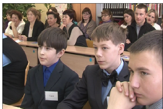
Мастерство педагога – пробуждать мысли в умах пытливых.

Молодые педагоги сходятся во мнении, что подобные мероприятия помогают им обрести уверенность, а также это возможность получить хорошую методическую помощь.