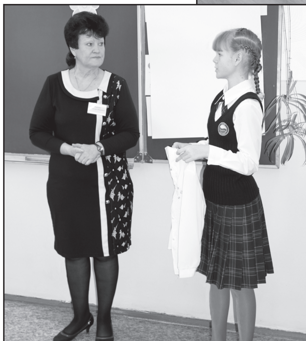
На межведомственном семинаре-практикуме