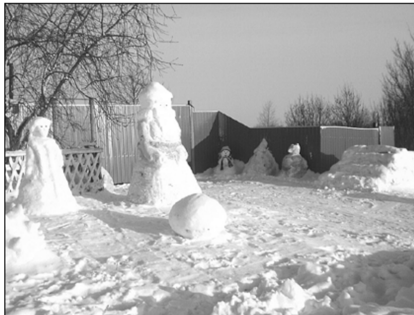
Снежное королевство у дома Булдаковых