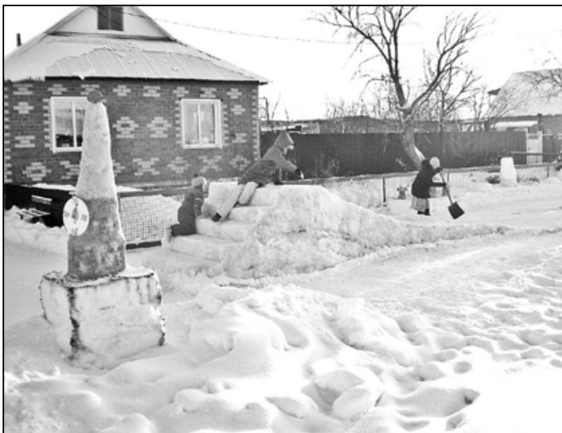
На горке у дома Огнёвых кататься одно удовольствие