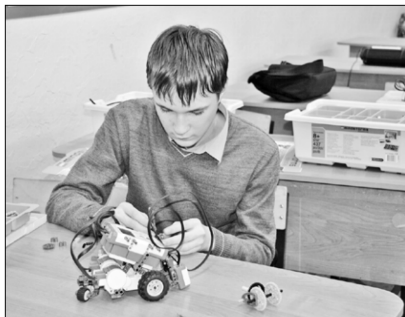
Собирать сложных роботов – занятие интересное

– Может быть, дети, занимающиеся робототехникой, в будущем реализуют идеи, востребованные в жизни, – сказала мне заведующая