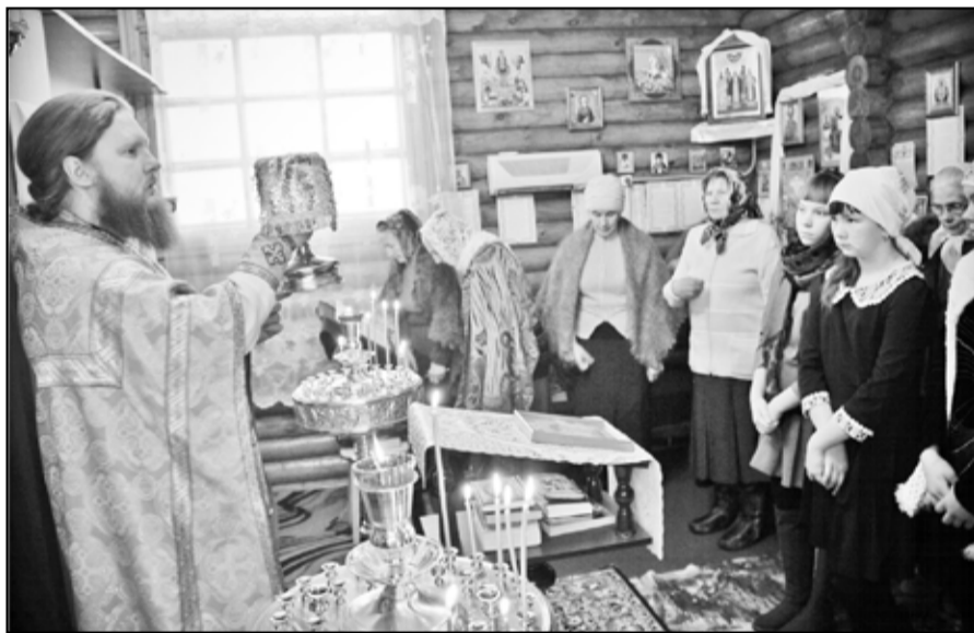
«Примите, ядите: сие есть Тело Мое, еже за вы ломимое во оставление грехов!»