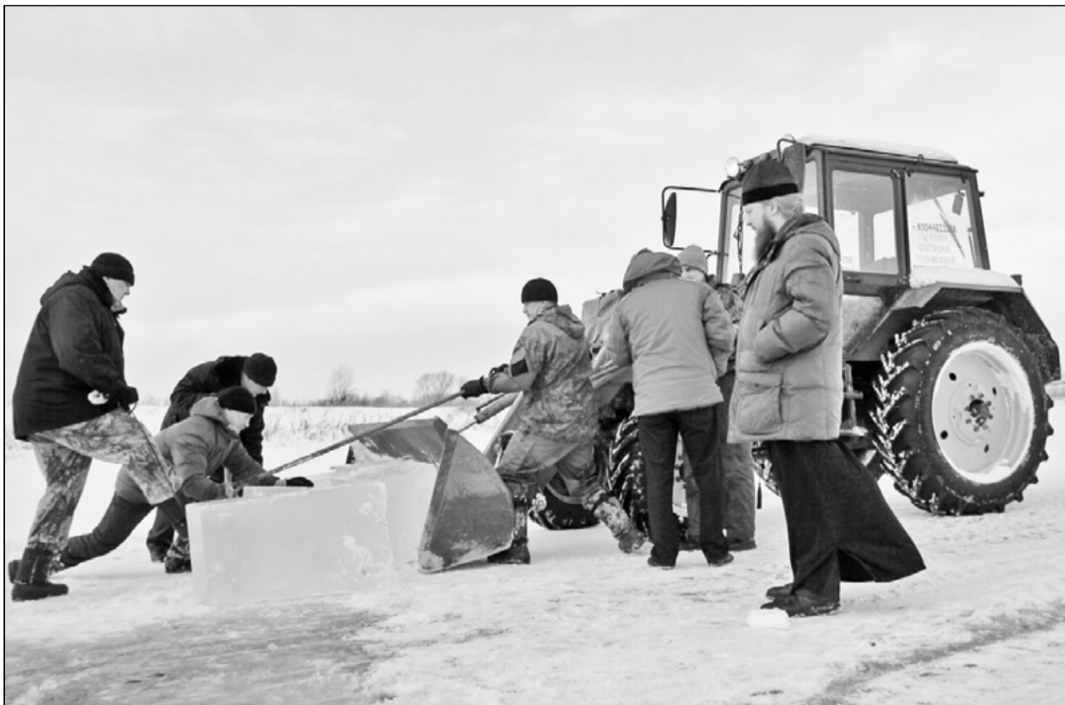
Подготовка крещенской иордани

В понедельник, 19 января, православные христиане отметят большой, светлый и исполненный глубокого духовного смысла праздник – Крещение Господне, иначе называемый Богоявлением. Этот праздник установлен в память о явлении людям Бога в Трёх Лицах, которое произошло при крещении Господа нашего Иисуса Христа в водах реки Иордан.