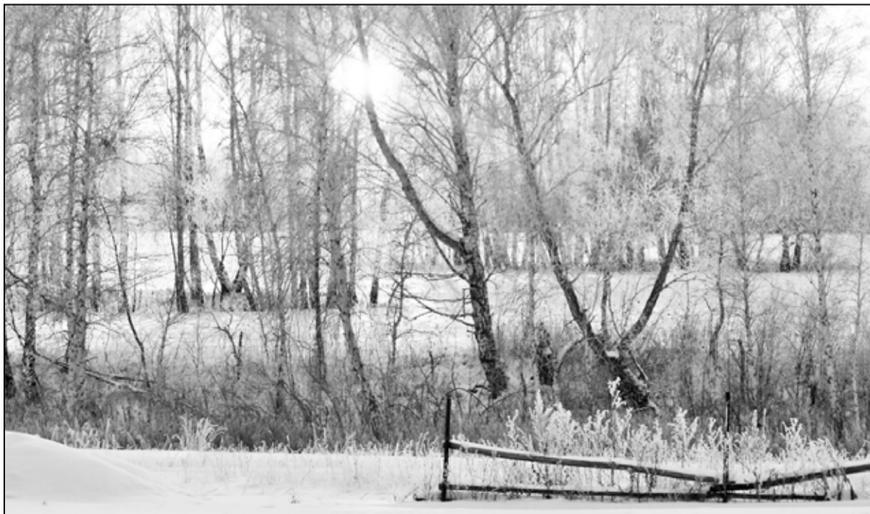
Вдохновляют писателя красоты родной природы

директор центра физкультурно-оздоровительной работы