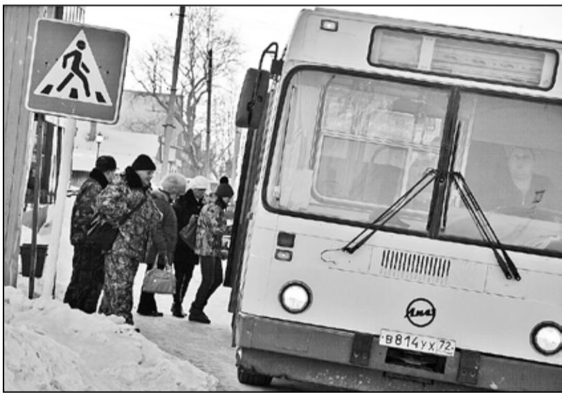
Рейсовые автобусы пользуются спросом у местного населения