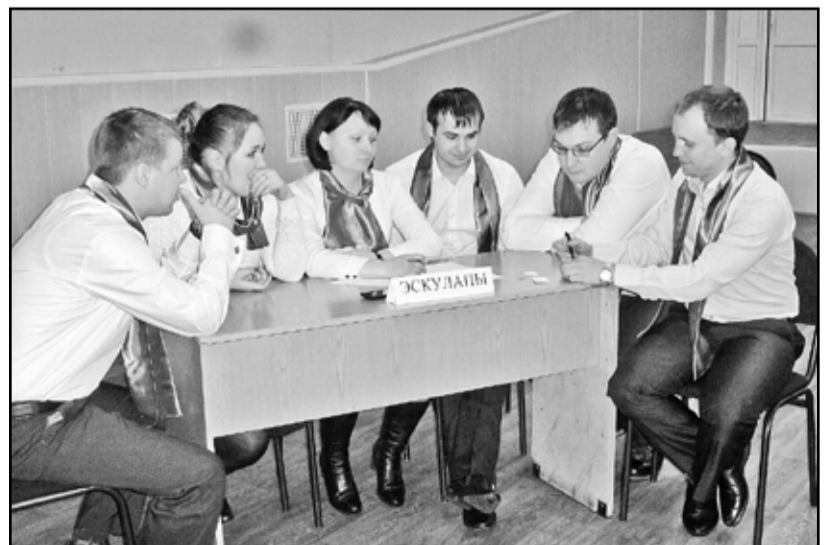
Команда-победительница готовит ответ на очередной вопрос