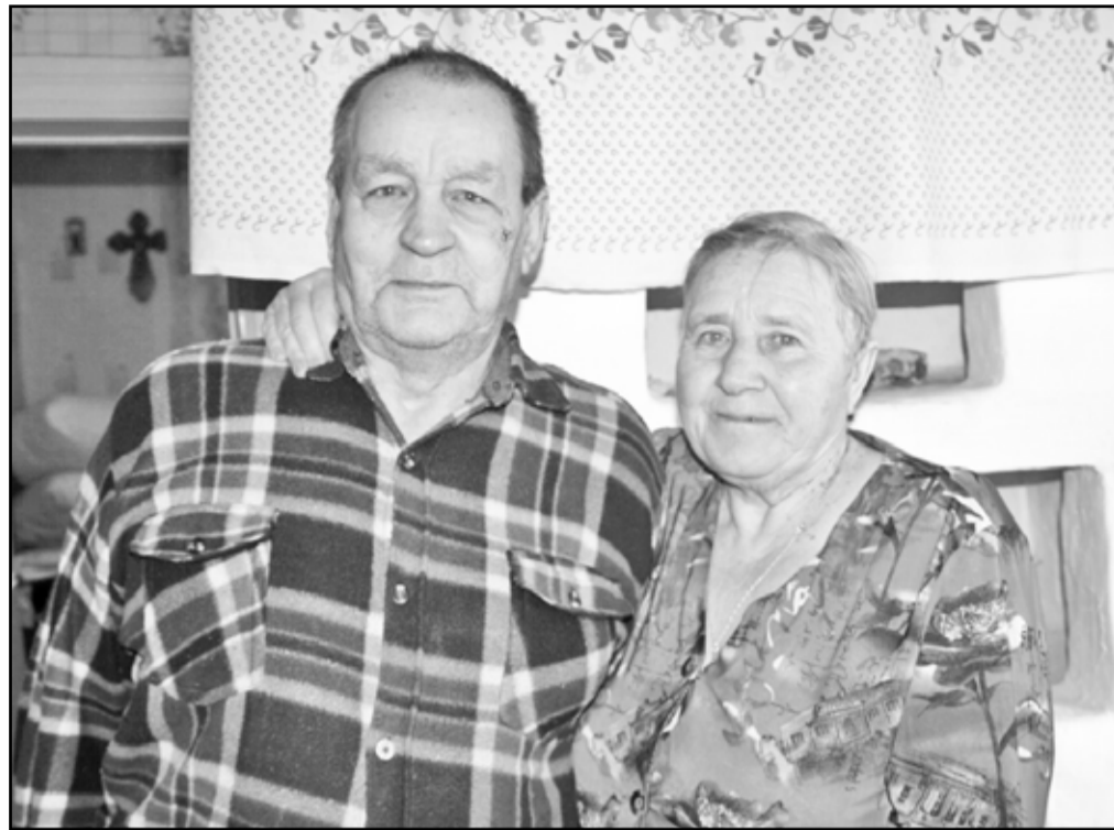
Семья русских немцев живёт в аккуратном домике с русской печкой