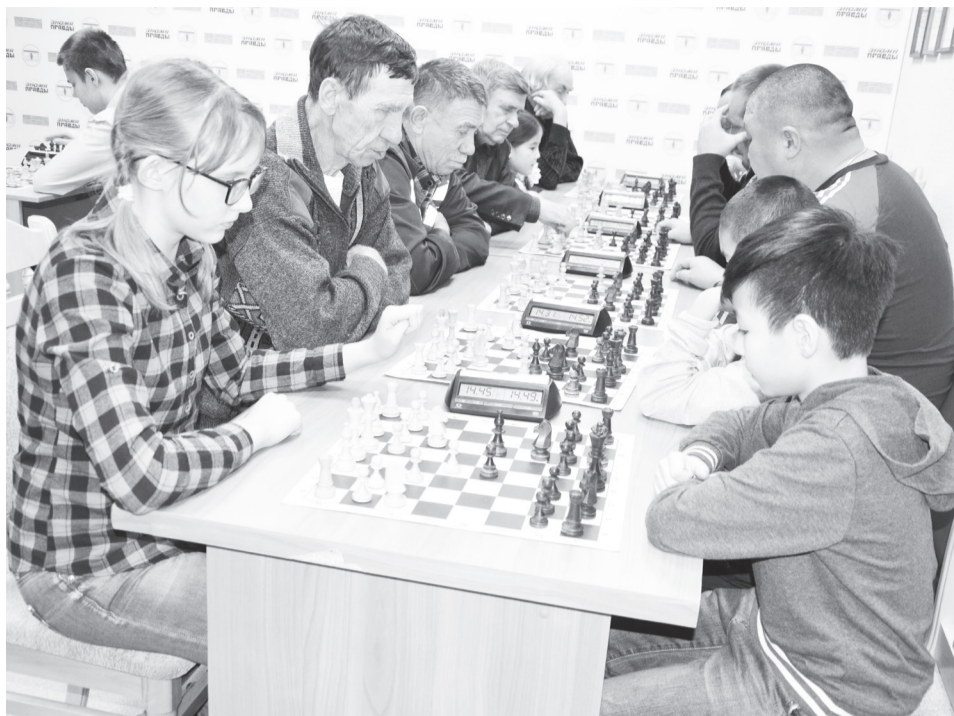
И взрослые, и дети сражались за победу.

Редакция газеты «Знамя правды» продолжает свои добрые традиции.