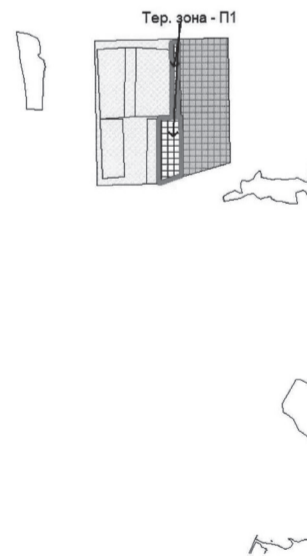
Приложение №1 к решению Думы Упоровского района от 21.11.2019 г. № 263