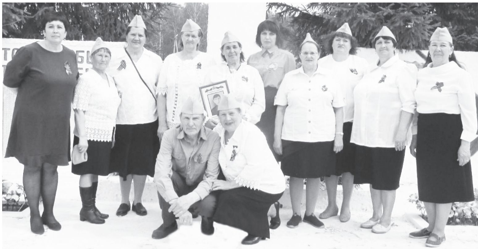
Они считают своим долгом перед поколением победителей – сохранить историческую память, не оставить в забвении ни одного погибшего солдата.

Особо остро стоял вопрос сбора и вывоза мусора. На протяжении двух лет велась актив-