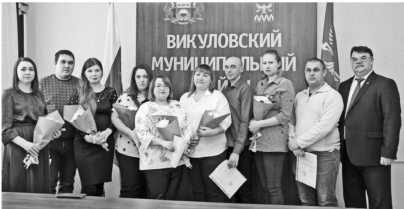
Торжественное вручение сертификатов молодым семьям

Вручение сертификатов молодым семьям на получение социальных выплат на приобретение жилого помещения или строительство состоялось в администрации Викуловского района 7 февраля. Каждый год молодые семьи, участвующие в ведомственной целевой программе «Оказание государственной поддержки гражданам в обеспечении жильём и оплате жилищно-коммунальных услуг» государственной программы РФ «Обеспечение доступным и комфортным жильём и коммунальными услугами граждан РФ», в 2023 году по Тюменской области, получая материальную поддержку, приближаются к своей заветной мечте — приобретению своего жилья.